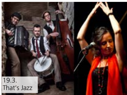
19.3. That's Jazz