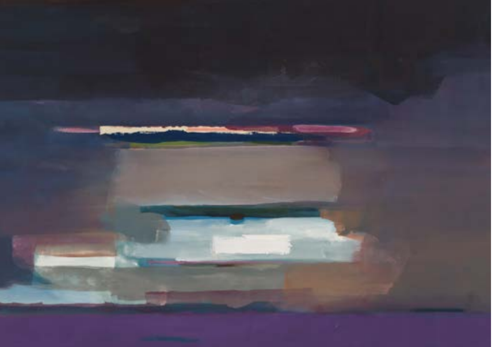
Helene Frankenthaler Foundation / Bildrecht Wien