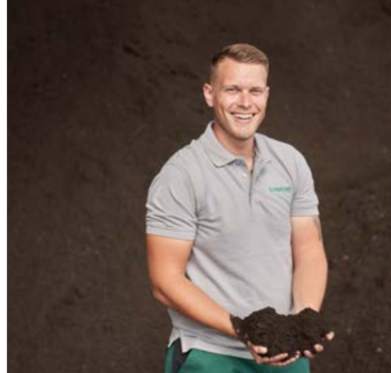
Erdenreich der Brantner Österreich GmbH ist die größte und modernste eingehauste Kompostanlage Österreichs und kann als einziger Hersteller gleichbleibende Produktqualitäten anbieten.