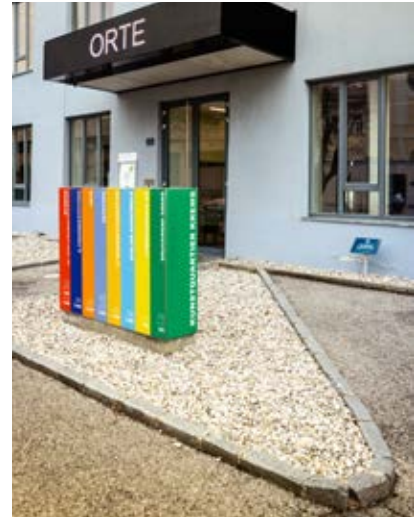
Text und Fotos: Pamela Schmatz

In der Bibliothek gibt's meterweise Inspiration rund ums Bauen und Gestalten. Ab Herbst möchte Heidrun Schlögl den Raum auch zur Architektur-Galerie machen.