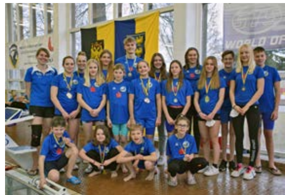
Eine Top-Leistung gelang den Kremser SchwimmerInnen bei den jüngsten NÖ Landesmeisterschaften, ausgetragen in Krems: Sie erkämpften 20 Gold-, 32 Silber- und 29 Bronze-medailien